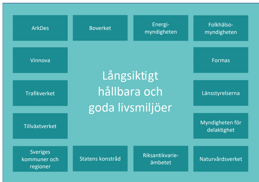
Bild 3: Illustration av sektorer för Rådet för hållbara städer.

Rådets medlemmar har i uppdrag att utifrån sina olika sak- och kompetensområden stödja kommunerna i deras arbete med att uppnå långsiktigt hållbara och goda livsmiljöer. Rådet har därför valt att se medlemmarnas olika sakområden som de olika sektorerna i modellen. Sektorerna representerar olika perspektiv som behöver vävas samman för att nå helhetssyn. Rådet valde att illustrera sektorer på följande sätt: