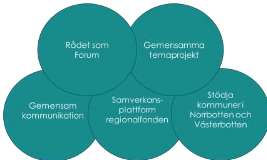
Bild 4: Illustration av rådets fem fokusområden.

Till varje fokusområde finns aktiviteter kopplade. Vissa aktiviteter genomförs löpande och andra är punktinsatser. Aktiviteter kan läggas till under året. Samtliga aktiviteter som genomförs är för hela rådet, men alla organisationer behöver inte delta aktivt i varje aktivitet. Pågående aktiviteter tas upp som en stående punkt på råds- och expertnätverksmöten för kort rapportering så att alla är uppdaterade på status i rådets olika aktiviteter.