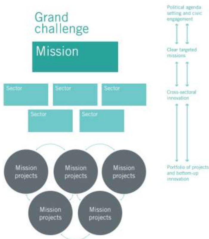
Bild 2: Illustration av Missionsmetoden.

Missionsmetoden som valdes för att komma fram till Rådet för hållbara städernas långsiktiga inriktning innebär att Grand Challenge, Mission, Sectors och Mission Projects identifierats.