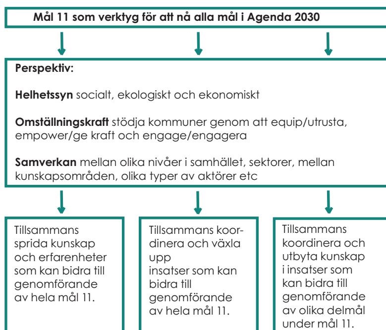
Figur 2. Illustration över Rådets arbetssätt. Det övergripande målet utgörs av Agenda 2030 mål 11. Rådets arbete utgår från perspektiven helhetssyn, omställningskraft och samverkan. Rådets samverkansåtgärder grupperas i tre olika kategorier.

Rådets uppdrag är att stärka kommunernas förutsättningar att utveckla levande och hållbara städer och samhällen. Det övergripande målet för Rådet utgörs av mål 11 i Agenda 2030, Hållbara städer och samhällen. Flera av målen i Agenda 2030 överlappar varandra och Rådet identifierar i olika åtgärder på vilket sätt arbetet med mål 11 även kan stärka andra mål i agendan. Utgångspunkten är att de åtgärder som Rådet genomför ska ha ett helhetsperspektiv och bidra till flera mål samtidigt.